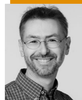
Roman Fröhlich Marketing & Communication, Banque Alternative Suisse

La Banque Alternative Suisse SA appartient à ses quelque 6'500 actionnaires. Le total de son bilan est d'environ 1,8 milliard de francs, et elle réunit plus de 35'000 clients.